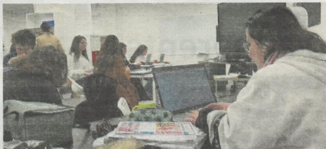
La filière BTS de l'Institution Saint-Gabriel s'est installée dans un local au pied du pont Henri-IV.

Deux BTS (sur deux ans, donc) y sont dispensées, en partenariat avec le CFA de Poitiers Isaac-de-l'Étoile : Opticien lunetier et Management commerce opérationnel. Pour cette année